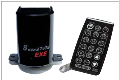
●赤外線リモコン 受光部 ※オプション