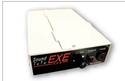
●音声ボックス [縦65mm×横150mm×奥行き220mm]