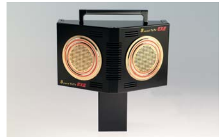
●スピーカー取付金具(角タイプ) ※オプション