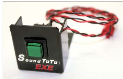
●スイッチユニット