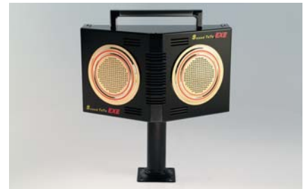
●スピーカー取付金具(ポールタイプ) ※オプション