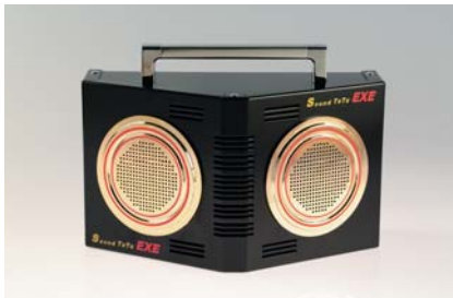
●スピーカーユニット [縦130mm×横230mm×奥行き110mm] ※スピーカー上部のハンドルはオプションです。